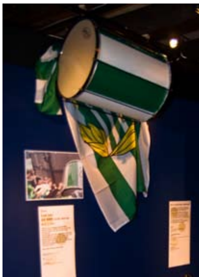
Hammarbyklackens trumma.

Inspelning från Söderstadions läktare, Stockholm 2007