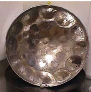
Steelpan (sopran), där man tydligt ser de utbankade tonerna.

Tenor pan, tillverkad 1980 i Stockholm av steelpantillverkare från Trinidad.