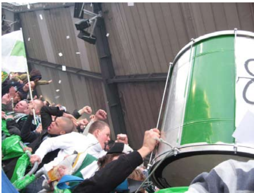
Medlemmar i Hammarbyklacken med sin trumma.

Inspelning från Söderstadions läktare, Stockholm 2007