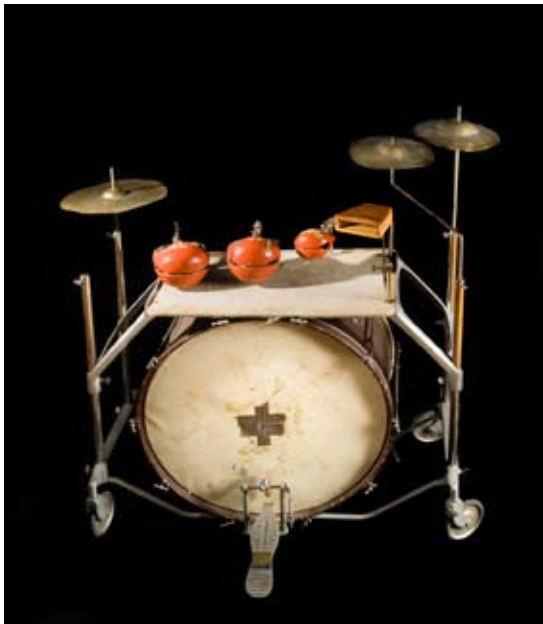
Ett så kallat trumbord från 1920-talet.