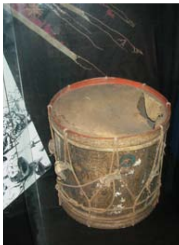
Cylindertrumma som bär spår av krig.

De pojkar som lärdes upp till trumslagare kom ofta från fattiga familjer. I armén fick de mat, kläder, husrum och en viss status. De fick extra fina kläder och fick gå i främsta ledet – ärorikt men farligt. Trumslagarna måste vara mycket modiga. De gick tillsammans med fanbäraren. De hade ingen möjlighet att försvara sig och fick aldrig släppa trumman. Det var dödsstraff på att släppa trumman i strid! Under 30-åriga kriget hade soldaterna ofta med sig hela familjen ute i fält. När en trumslagare blev dödad var det vanligt att sonen tog över hans uppgift.